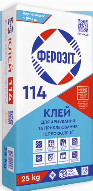
Фасування: 25 kg (кг)

ФЕРОЗИТ 114 — армована волокном полімермінеральна модифікована суха клейова суміш на основі високоякісного цементу та модифікаторів провідних європейських виробників для закріплення плит з пінополістиролу (в тому числі екструдованого) та мінеральної вати на цегляних, бетонних, поштукатурених поверхнях та виконання гідрозахисного армованого шару при влаштуванні систем утеплення будівель на фасадах будівель до третього поверху включно. Для зовнішніх та внутрішніх робіт.